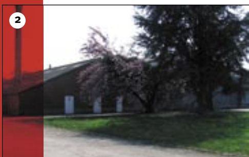
2. De Vriesdrogerij