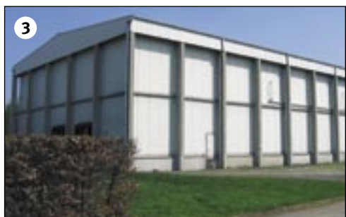
3. Vrieshuis voor de opslag van diepgevroren kruiden