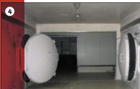
4. Ruimte met vriesdroogketels