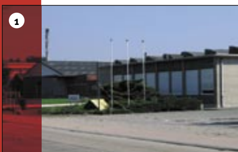
1. VNK/Lyobel in Hulshout

Vriesdrogen is een industriële methode die vanouds wordt toegepast voor het conserveren van levensmiddelen en geneesmiddelen. Het principe van vriesdrogen is dat door de lage temperatuur (-30, -40) de watermoleculen worden opgenomen in ijskristallen. Hierdoor wordt de lucht extreem droog en het water aan het te drogen product onttrokken. Dit proces is gebaseerd op het verschijnsel sublimatie: het direct overgaan van vaste vorm naar damp. Door levensmiddelen te vriesdrogen blijft de smaak beter behouden, nemen volume en gewicht af en het product is veel langer houdbaar. Een ander groot voordeel van vriesdrogen is het feit dat micro-organismen als bacteriën niet kunnen leven in een omgeving met een groot gebrek aan water. Hierdoor wordt het product veel beter geconserveerd. Tot de gevriesdroogde producten behoren: soepen, thee en oploskoffie.